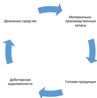
Рис. Кругооборот оборотных средств организации

В процессе кругооборота оборотные средства проходят 4 стадии, последовательно меняя свою материально-вещественную форму, что более наглядно представлено на рис: